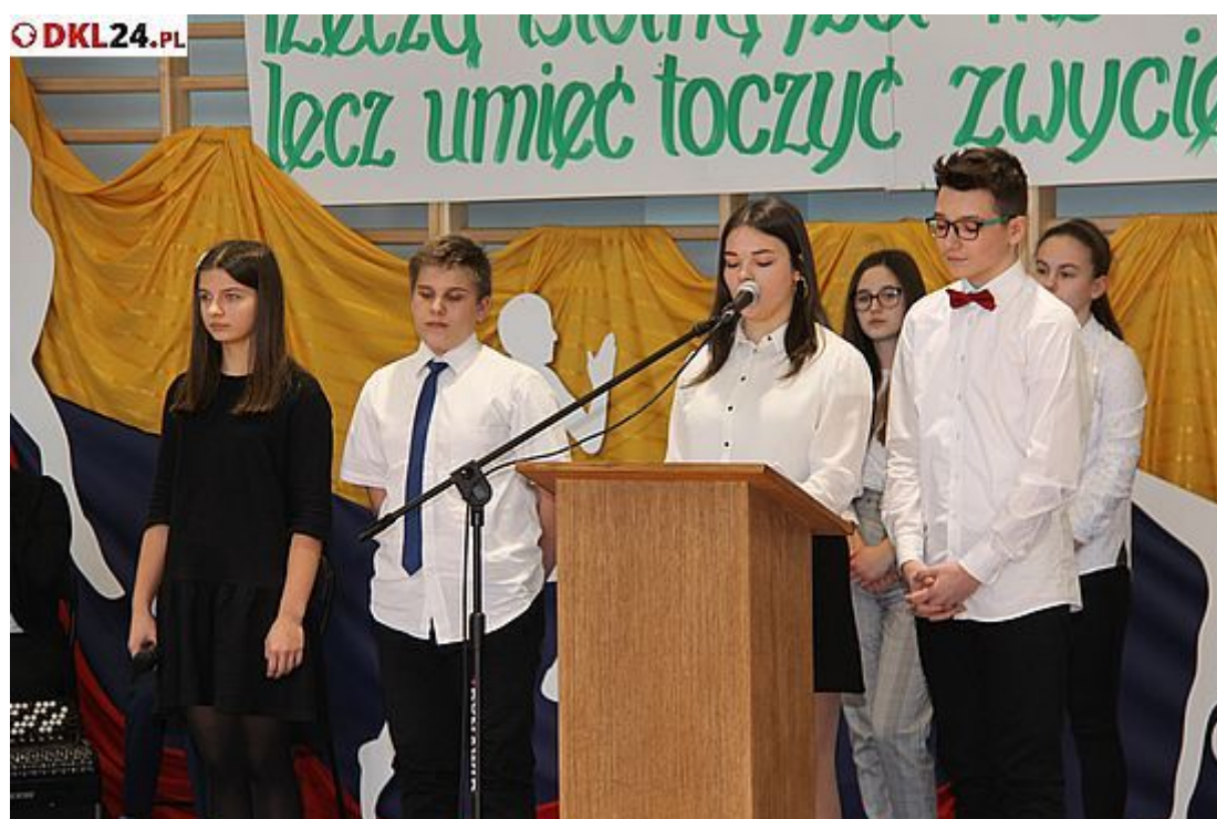
W drugiej części wydarzenia do głosu doszli uczniowie SP nr 2