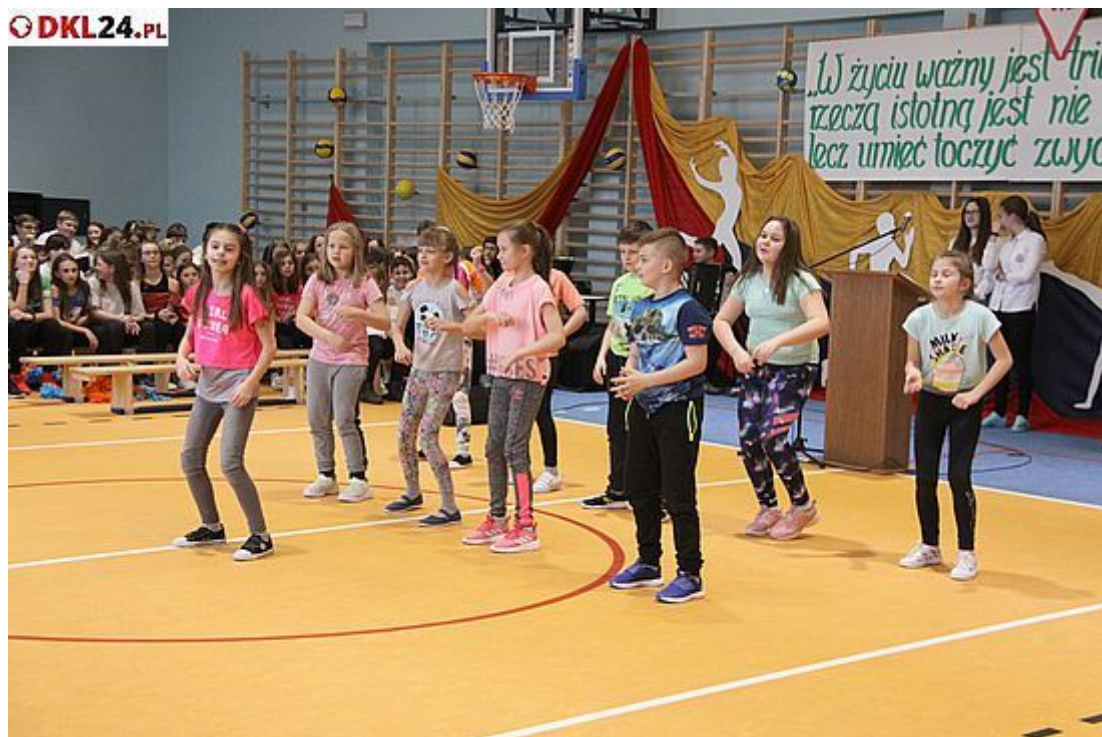
Nie mogło zabraknąć miejsca dla młodszych wykonawców części artystycznej

W czasie uroczystości burmistrz podziękowała osobom i instytucjom, którzy najbardziej przyczynili się do sprawnego przeprowadzenia prac. A po symbolicznym przecięciu wstęgi grupy uczniów SP nr 2 przedstawiły program artystyczny na sportowo.