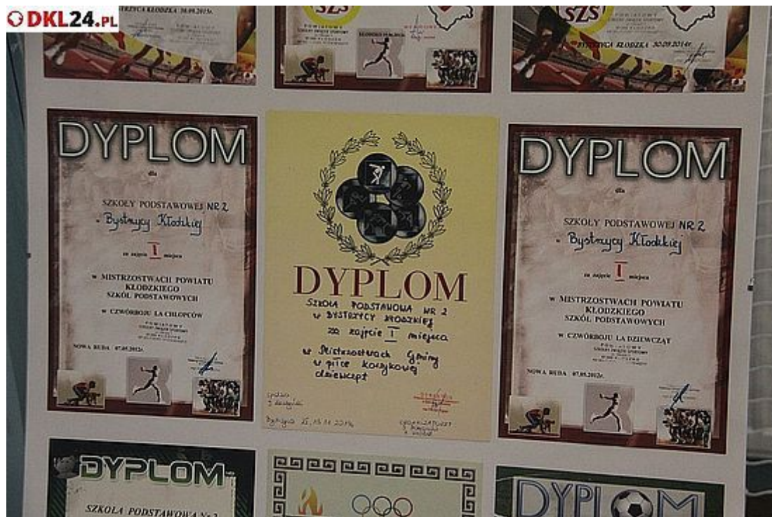
Pięknie wykonany obiekt ma sprzyjać najlepszym dokonaniom sportowym Dwójki