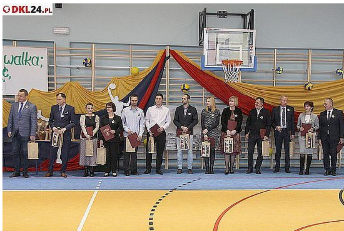
Podziękowano osobom i firmom, dzięki którym obiekt tak się zmienił