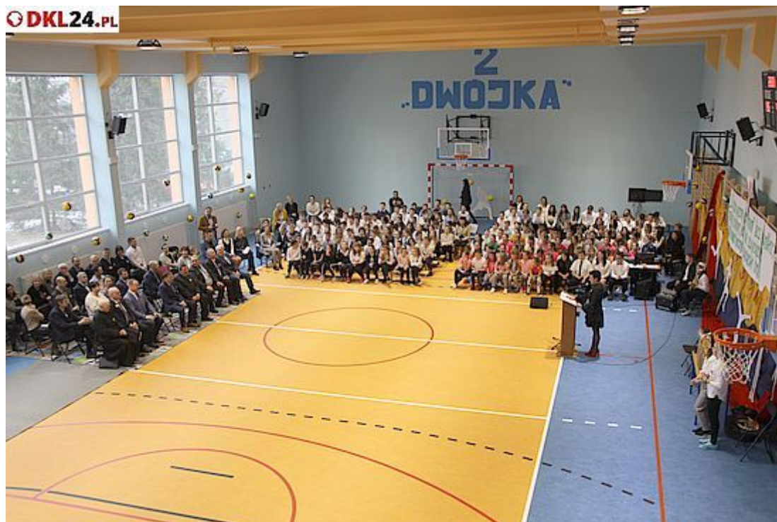
A tak prezentuje się teraz, po zakończeniu robót