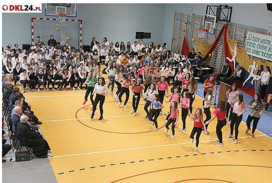
Prezentacjom bacznie przyglądali się goście i społeczność szkolna