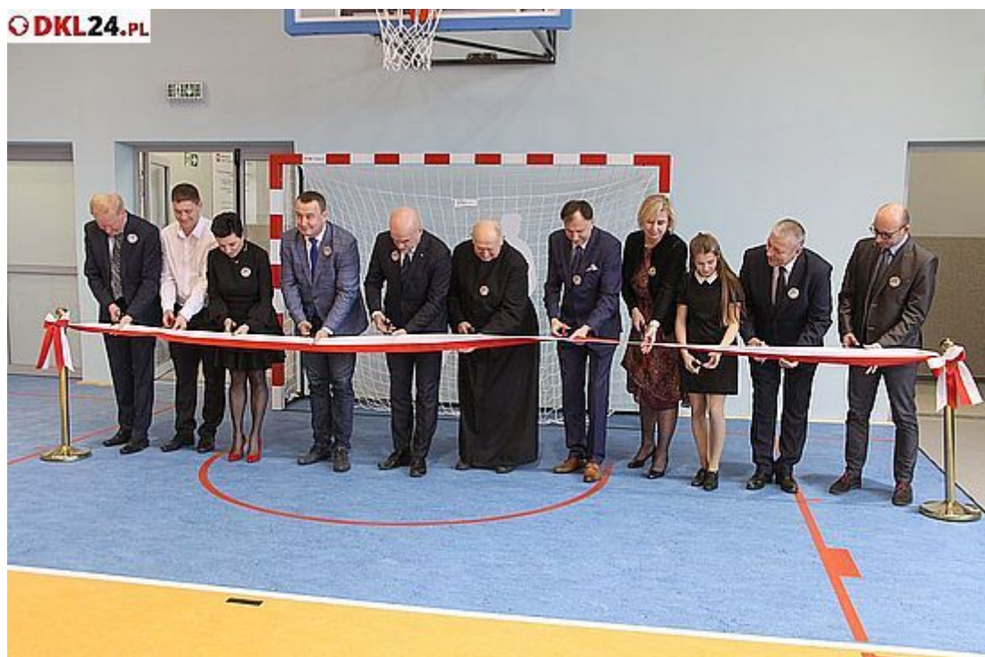
Przyszła chwila na oficjalne przekazanie sali

Spółeczność Szkoły Podstawowej nr 2 w Bystrzycy Kłodzkiej wraz z zaproszonymi gośćmi uczestniczyła w ostatni poniedziałek stycznia w niecodziennym wydarzeniu. Jak zauważyła burmistrz Renata Surma - było ono możliwe, dzięki obietnicy premiera Mateusza Morawieckiego danej podczas wizyty w tym mieście, że wspomże już niezbędny remont sali gimnastycznej i łącznika. Wkrótce po tym do placówki przyjechała trójka ministrów, aby rozeznaczyć sytuację, a w jakiś czas później ze stolicy nadeszła informacja o przyznaniu gminie dotacji na zaplanowane zadanie.