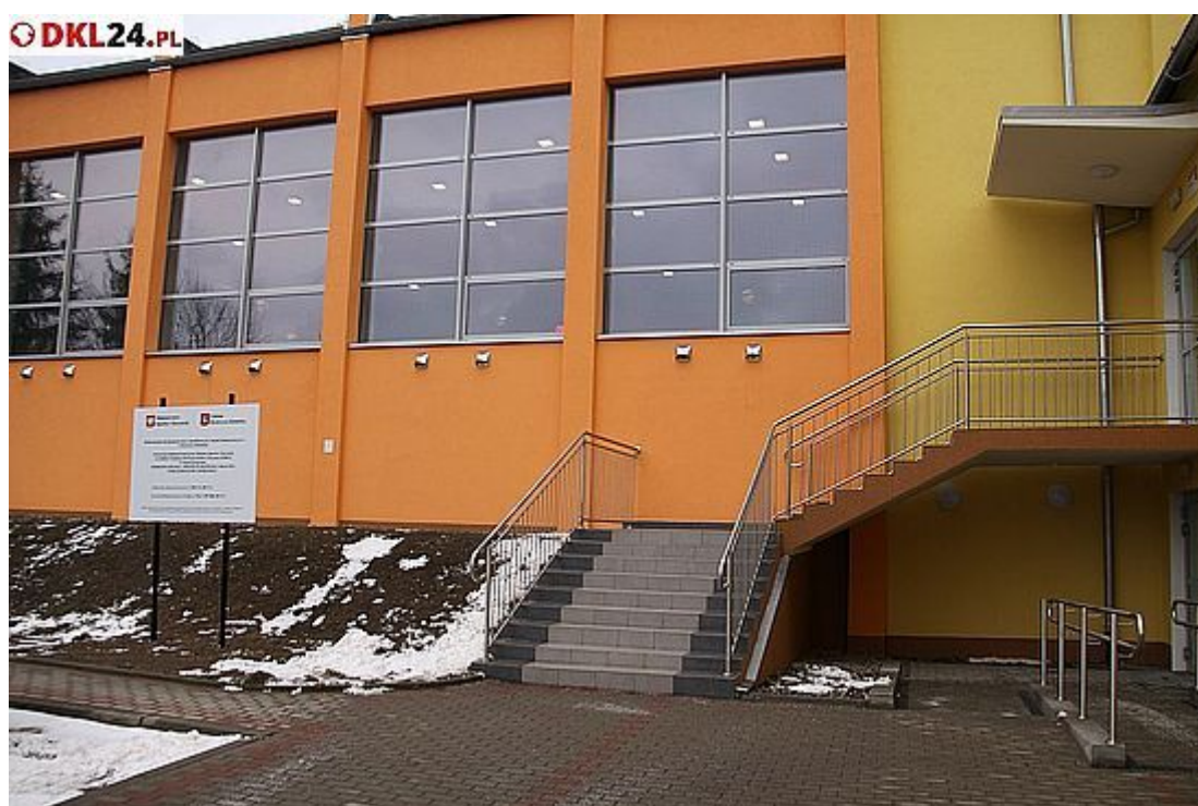
Na zewnątrz też cieszy oczy nowością i kolorystyką