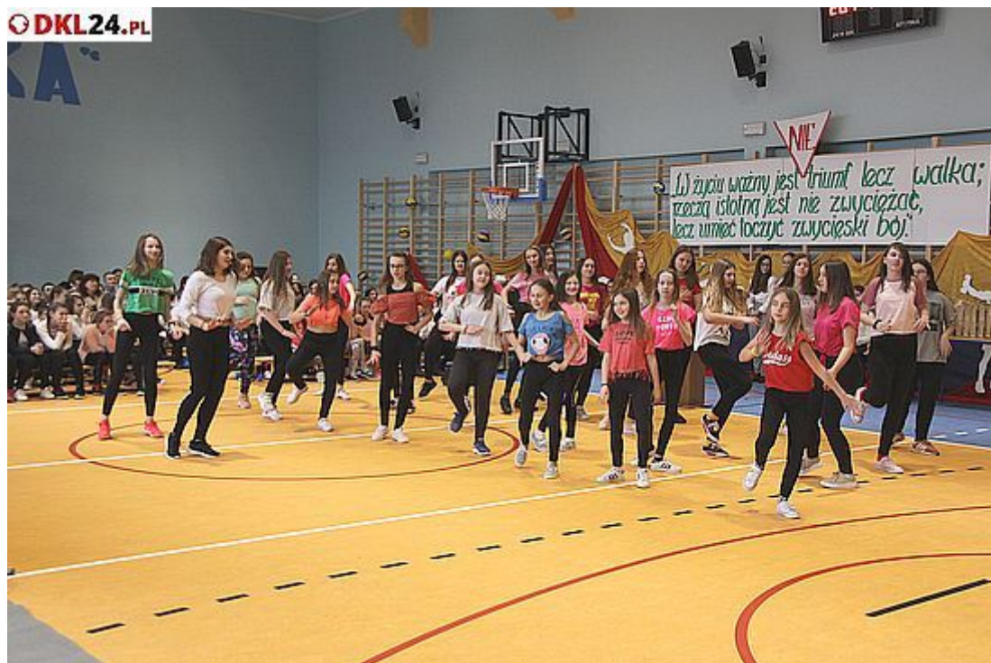
Na parkiecie szybko zaczął się sportowo-taneczny ruch